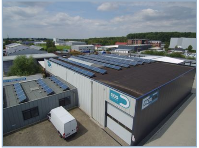
Lagerhalle mit Rolltor